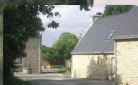
Le Resto 4