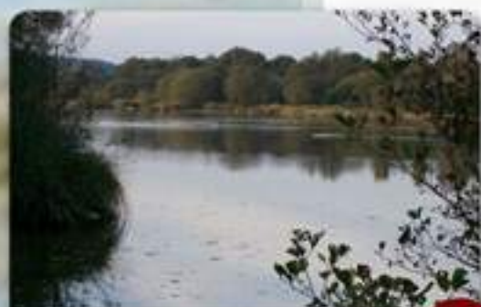
Etang de Rhodes