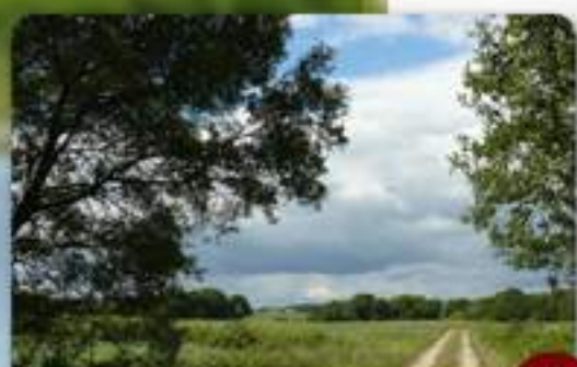
Entre Kervenant et Bréhigair