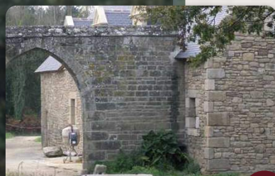
Manoir de kergatorne

Prendre à droite, traverser le pont et à droite longer l'atelier communal vers la Fontaine Maria , 7 puis rejoindre l'église en passant par la rue du Puits.