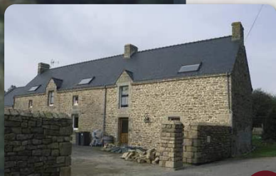
Village de Kernours

Traverser la D9, cheminer à gauche puis bifurquer à droite en direction du village de Manéguen .