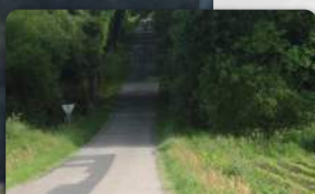
Vers Lesteno 2