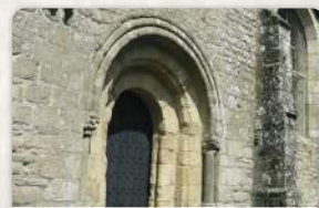
Eglise romane du XIIème 1

L'église romane Notre Dame de la Joie (XIIème siècle), édifice religieux majeur, chemins dans les bois, la Fontaine Maria (Fetan Varia en breton)