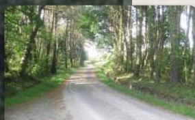
Vers Kergatorne 5