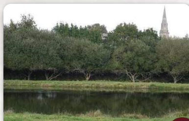
Etang route de lezevarc'h