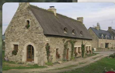
Chaumière à trevelzun

A mi-village tourner à gauche pour suivre le chemin qui conduit à Trevelzun. 4 Poursuivre entre les maisons rénovées et prendre à droite. Couper la D33, continuer en face en suivant le chemin jusqu'au bois, puis tourner à gauche vers Kergatorne 5 puis à droite vers Kerdaniel.