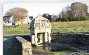
Fontaine Maria 7

De la place de l'église romane du XIIème siècle 1, prendre la rue d'Hennebont sur 50 mètres puis la rue du Pont Glaz à droite. La remonter entièrement et prendre à gauche le chemin des Prés de Locohin.