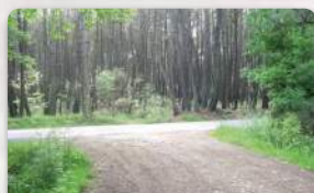
Chemin dans les bois 6