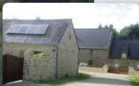
Chaumières au Lesteno 3