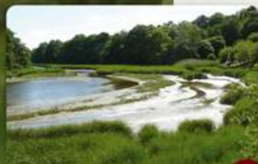
La Ria d'Étel