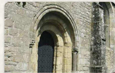
Eglise romane du XIIème

l'église romane Notre Dame de la Joie (XIIème siècle), édifice religieux majeur, le Manoir de Kergatorne, la Fontaine Maria (Fetan Varia en breton)